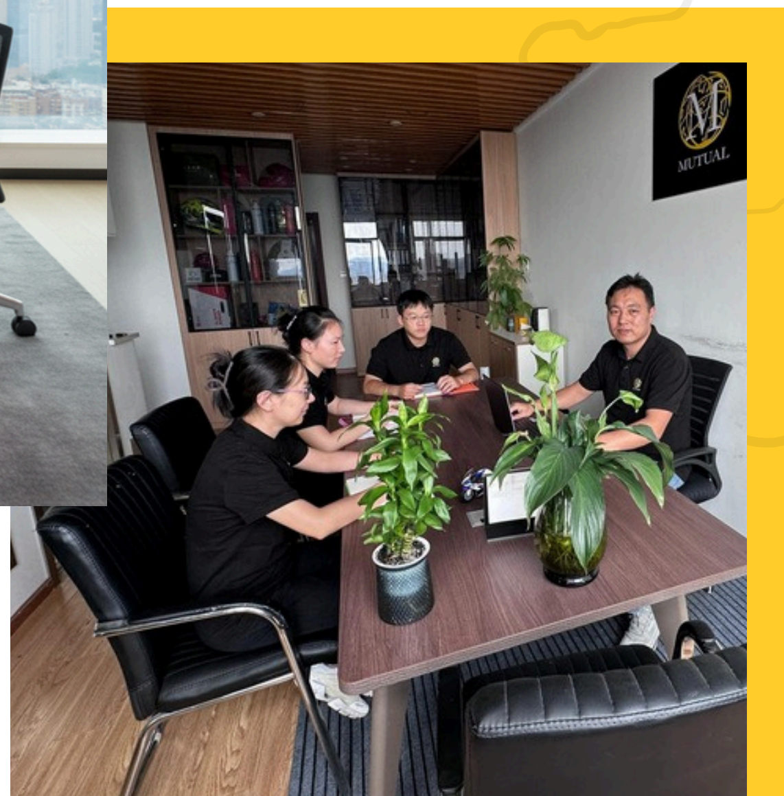
Equipe escritório – Hangzhou – China